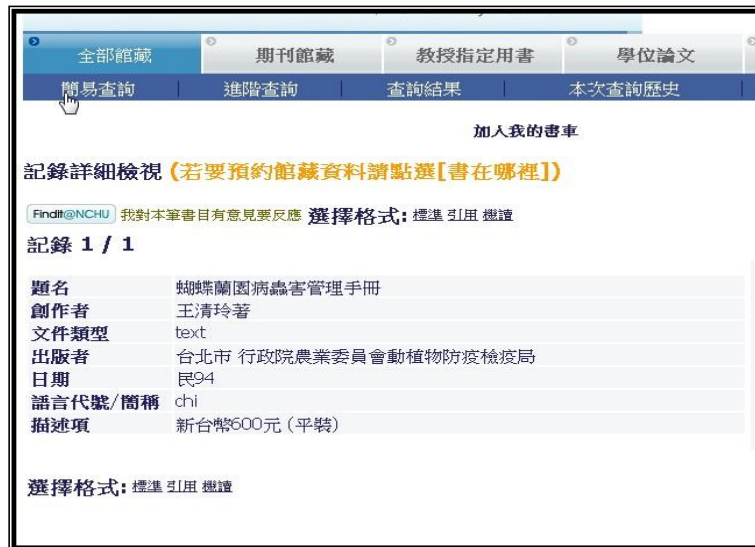
圖 3 原始書目紀錄資料轉換成 DC 之呈現畫面