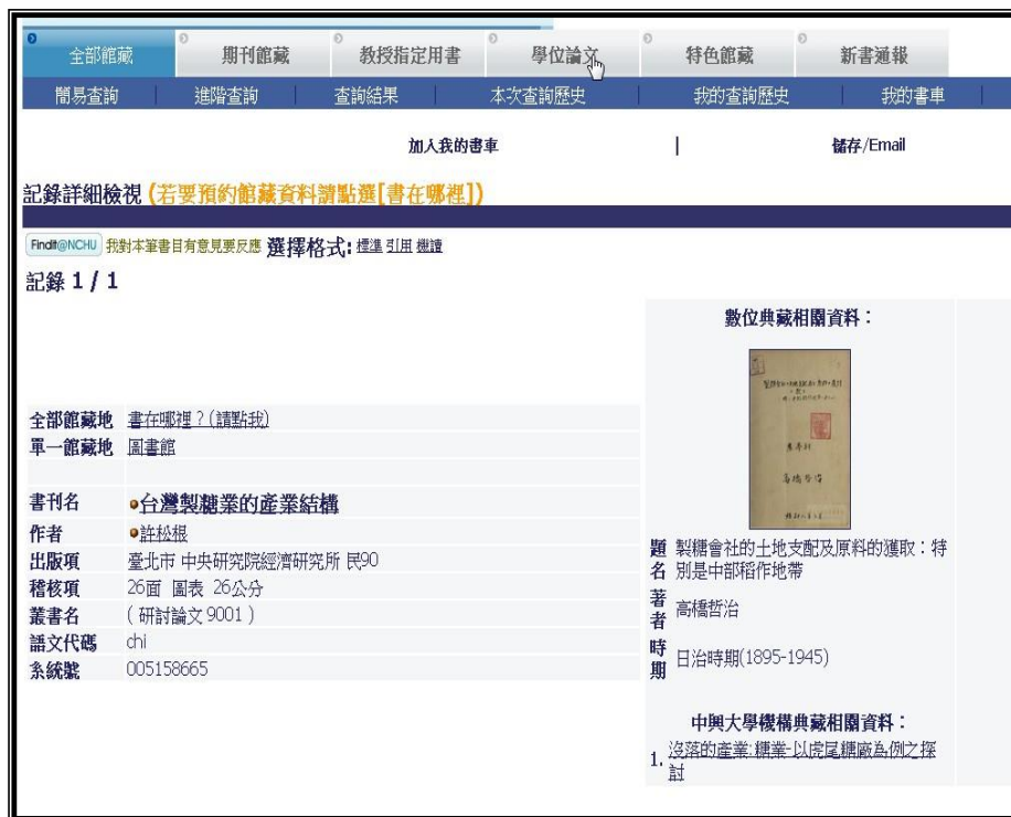
圖 5 原始書目紀錄資料+數位典藏品及機構典藏品之描述資料呈現畫面