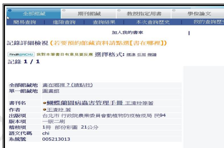
圖 1 原始書目紀錄資料呈現畫面

用者完整之檢索過程，包括受測者於檢索時、檢索過程中所遭遇之問題等。受測者需依據 3 個檢索問題之檢索結果，第一題進行步驟（二）之檢索畫面予以判讀，含原圖書館書目紀錄畫面（見圖 1）、同一筆書目轉換成 MODS 及 DC 格式之畫面（見圖 2 至 3）並加以比較；第二、三題進行查詢後將原始書目紀錄分別與書目+數典資料及書目+數典資料+機構典藏資料（見圖 4 至 5）之比較，測試者點選畫面中之數典資料與機構典藏資料，即可取得完整的相關藏品資料，並且據以說明此四種畫面的資料量及內容呈現方式之比較心得，過程中研究者需完整記錄受測者比較後的想法。之後填寫測試後問卷，期能蒐集研究參與者之具體感受與相關意見，最後進行資料整理與分析，並提出結論與建議。