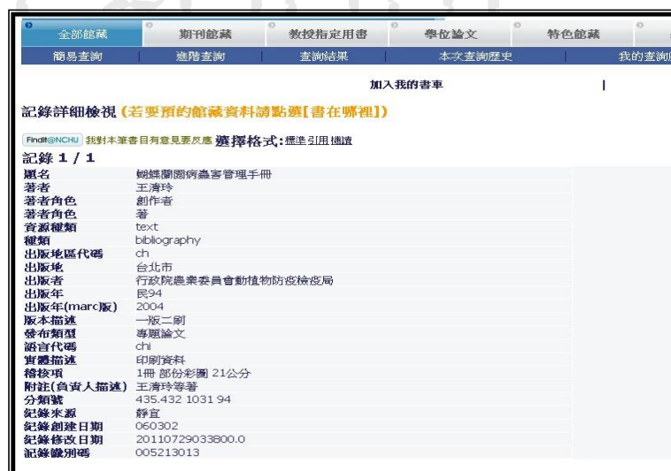
圖 2 原始書目紀錄資料轉換成 MODS 之呈現畫面