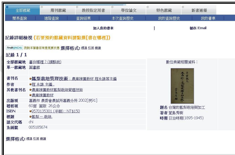
圖 4 原始書目紀錄資料+數位典藏品之描述資料呈現畫面